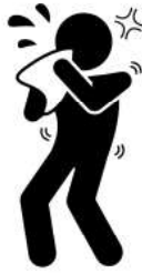
(a) Individu yang bergejala