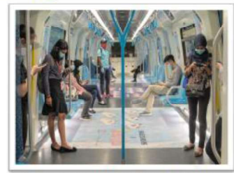
Pengangkutan: grab, teksi, bas, kereta api, kapal terbang