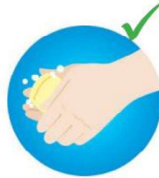
Cuci / sanitasikan