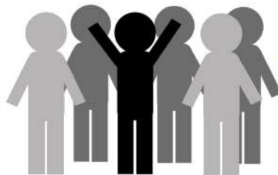
(b) Tempat yang sesak • Bazar ramadan • Pasar malam • Stadium