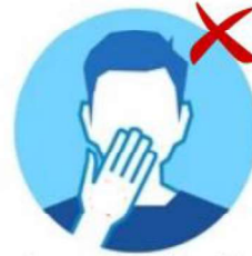
Jangan sentuh mulut, mata dan hidung